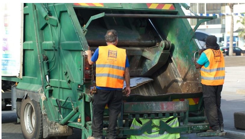
משאית זבל בפעולה

המודל הזה שונה משירותים בסיסיים אחרים שאנחנו מקבלים. כך, למשל, אנו משלמים את חשבון המים והחשמל החודשיים עת אותנו להיות זהירים יותר ולדאוג לסגור את הברז בין שימוש לשימוש, לא להפריז בזמן המקלחת, לכבות את האור כשיוצאים מחדר ומחושב על פי גודל הנכס שבו אנחנו מתגוררים או עובדים.