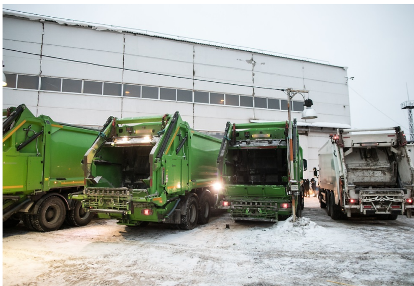
משאיות זבל

בנוסף, תחת מודל כזה ניתן להוציא חלק או את כל העלויות המיוחסות לפינוי פסולת מתוך המס העירוני, מה שיאפשר שקיפות להוריד עלויות שינוע וליצור חיסכון משמעותי לתושב ולרשויות המקומיות. כאשר תושב מייצר פחות פסולת ביתית, הרשות המקומית משלמת הזבל על הכביש. כל אלו מובילים בתורם לירידה בעלויות השינוע ואף מאפשרים חיסכון בהיטלי ההטמנה.